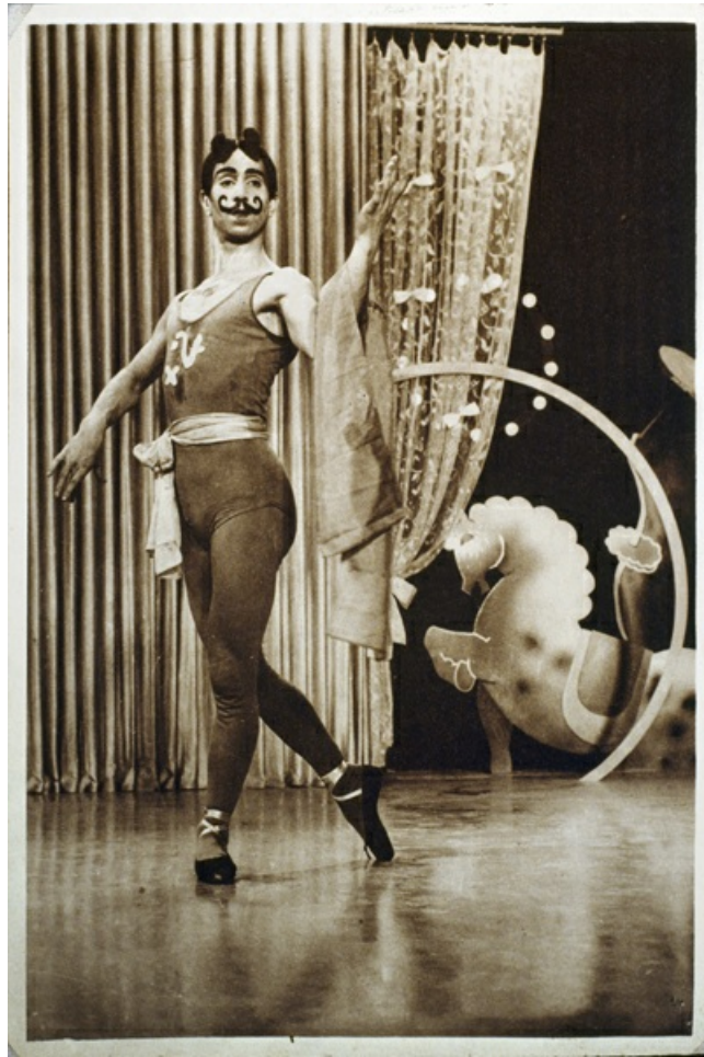
La polka de l'equilibrista (1932)