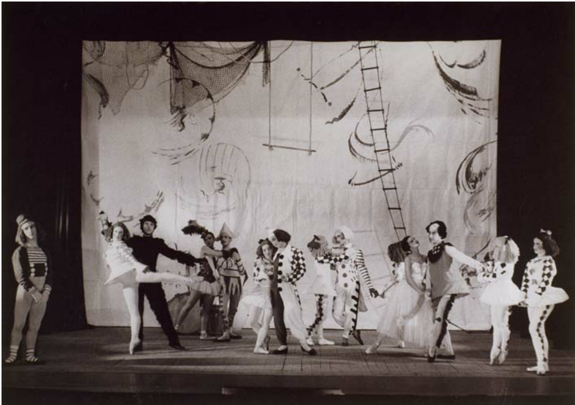
Ballet Joan Tena. Fantasia del circ