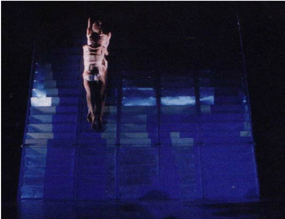
Blau i blanc (1986)